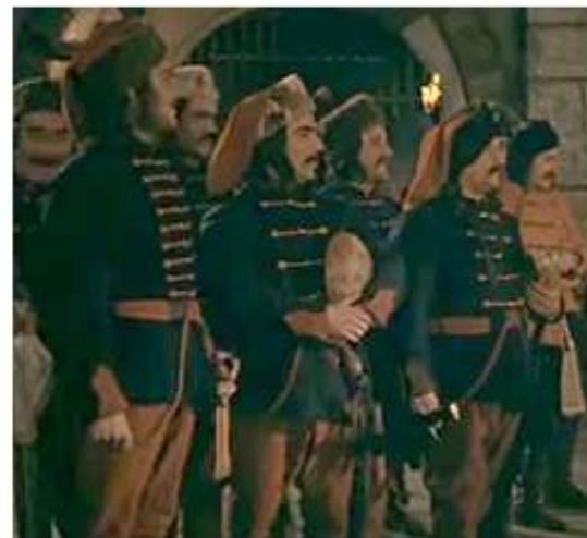
Rákóczi Hadnagya Filmből

(Joann Fabric boltban található, de lehet akármilyen bordó és barna anyagot használni) süveg = 0216-3657 soil brown, mellény = 0216-3335 burgundy Zsinórozáshoz ötletek = 496, 500, 501, 502 frog closure, www.dritz.com