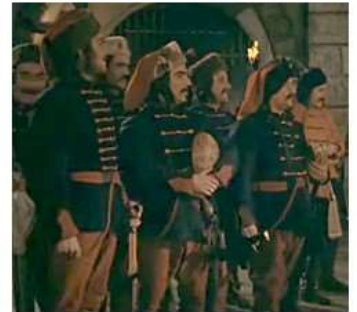
Rákóczi Hadnagya Filmből